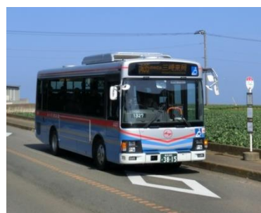
【一般路線バス車両】