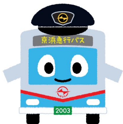
今回愛称が決定した【けいまるくん】

京浜急行バスは，京浜急行バスマスコットキャラクター「けいまるくん」が皆さまに愛着を持っていただけるよう，PR活動を行ってまいります。詳細については別紙のとおりです。