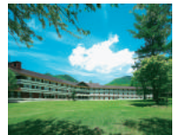
日光アストリアホテル

26A...湯元温泉行き 26B...日光駅行き 26C...歌が浜・半月山行き (季節運行)