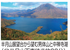
半月山展望台から望む男体山と中禅寺湖 (⑥)半月山下車徒歩約30分)

1A...湯元温泉・中禅寺温泉行き 1B...世界遺産めぐり 1C...奥細尾・清滝・大笹牧场・霧降高原行き ※霧降の滝行き(夏期運休)