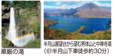
半月山展望台から望む男体山と中禅寺湖 (⑥半月山下車徒歩約30分)

26A…湯元温泉行き 26B…日光駅行き 26C…歌が浜・半月山行き (季節運行)