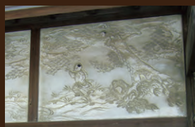
西叶神社の鏝絵(こてえ)