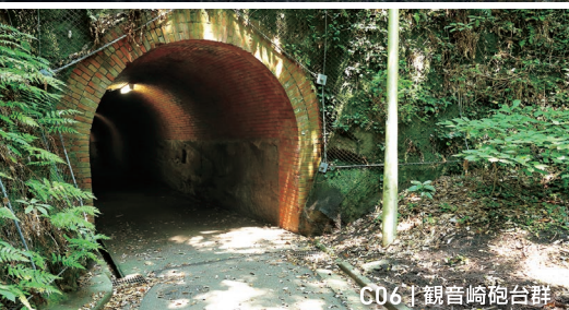
C06 | 観音崎砲台群