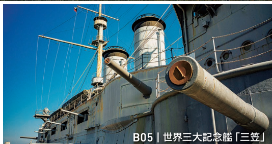
B05 | 世界三大記念艦「三笠」