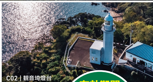
C02 | 観音崎燈台