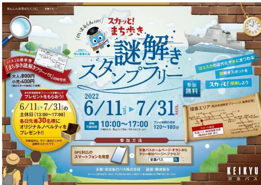
【ポスター】※イメージ