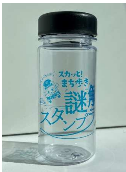
【オリジナルクリアボトル】