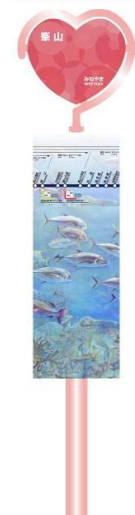
バス停デザイン イメージ 以上